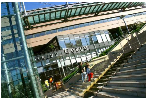
El Corum: Sala de Convenciones de Montpellier