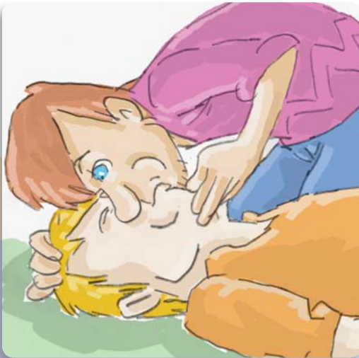
Figura 11: Administre dos respiraciones y compruebe que el pecho se levanta.