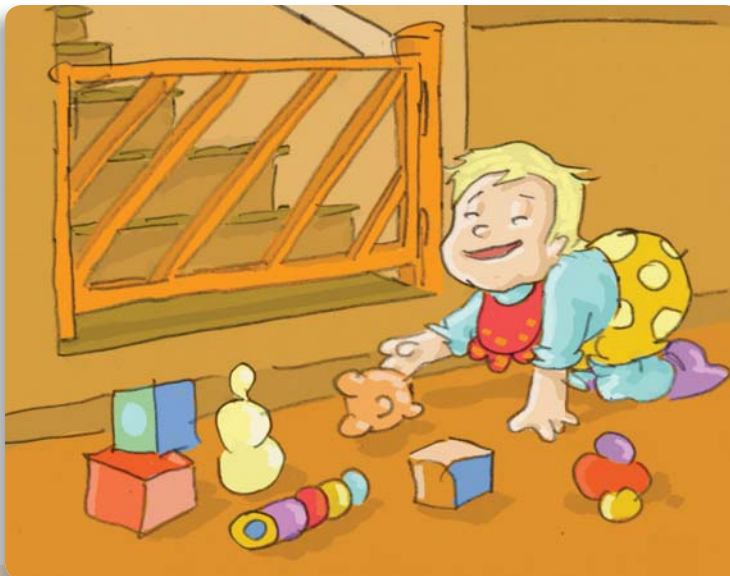
Figura 37: Proteger correctamente el acceso a las escaleras es fundamental para prevenir accidentes con bebés y niños.