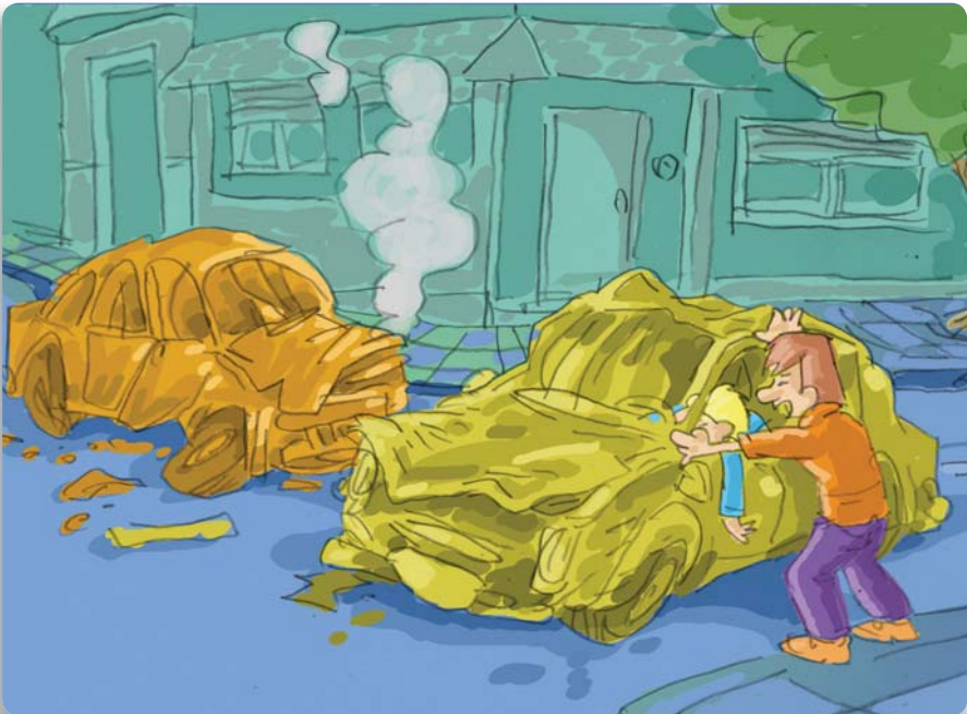
Figura 4: Una vez garantizada la propia seguridad y descartados los peligros potenciales, puede aproximarse al lesionado.

¿QUÉ PASÓ? - ¿CÓMO FUE? - ¿CUÁNDO SUCEDIÓ?