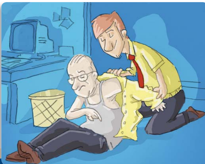
Figura 24: Mientras aguarda la ayuda, brinde confort y tranquilidad a la persona.