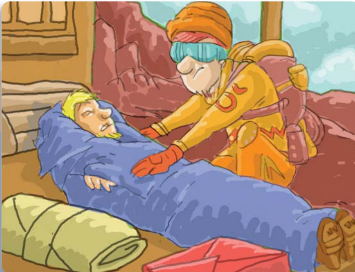
Figura 23: Quite la ropa húmeda de la víctima y abríguela utilizando ropa seca, mantas, toallas o papel de diario.