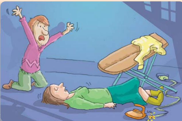
Figura 21: Nunca toque a una víctima de electrocución antes de estar seguro de que no transmite corriente.