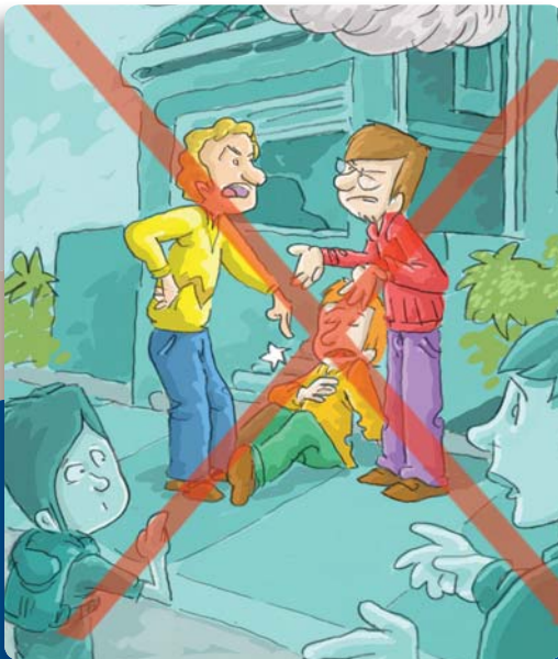
Figura 2: Recuerde, mientras dos personas discuten, las víctimas no están siendo atendidas.

En caso de que no haya un responsable o profesional, y usted pueda y se anime, inspire hondo y actúe con calma.