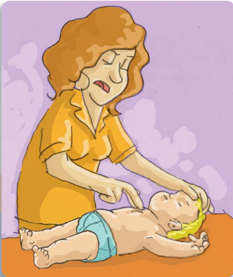
Figura 14: Para las compresiones en bebés es necesario utilizar dos dedos en el centro del pecho.

Las maniobras y los pasos para niños menores de un año también son iguales a los de RCP para adultos, pero con cambios en el punto 10. En este caso, coloque sólo dos dedos en el centro del pecho, entre los pezones, y realice 30 compresiones.