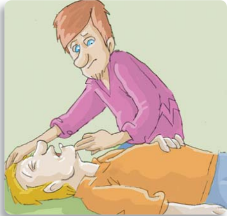
Figura 10: Inclínele la cabeza y élévele el mentón para abrir la vía aérea.