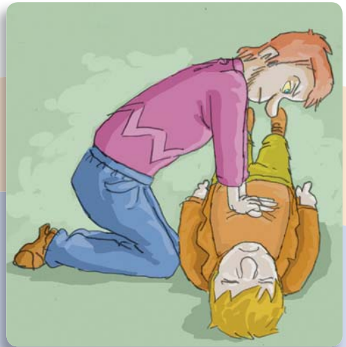
Figura 12: Acto seguido, realice 30 compresiones en el pecho.