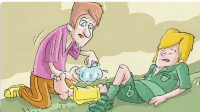
Figura 27: Coloque hielo en la zona de la fractura mientras espera la llegada de la ayuda especializada.