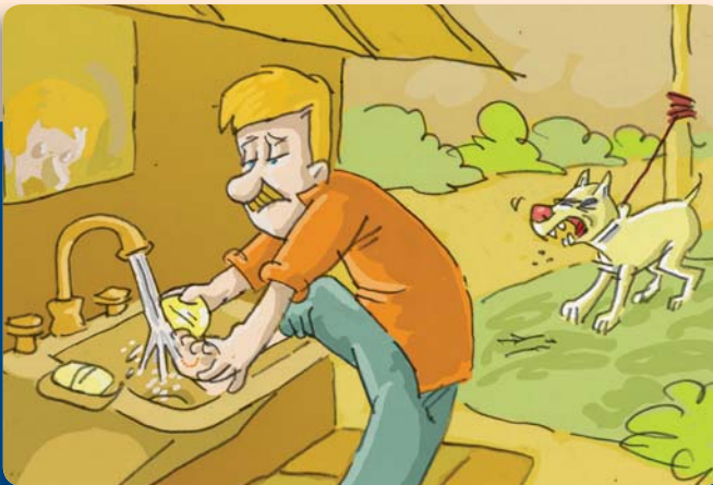
Figura 31: Siempre que sea posible, aisle al animal que provocó la mordedura antes de atender al herido.