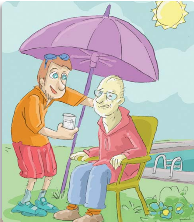
Figura 22: Intente brindar confort a la persona mientras espera la ayuda especializada.