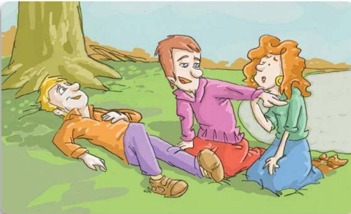
Figura 5: Sea claro y preciso a la hora de indicarles a los demás los pasos a seguir.

Si puede delegar la tarea en otra persona, indique claramente quién debe hacerlo. Asegúrese de que el destinatario del pedido entienda que le está hablando a él y dígame: “Usted, pida ayuda” . Si en ese momento se encuentra solo, hágalo usted mismo.