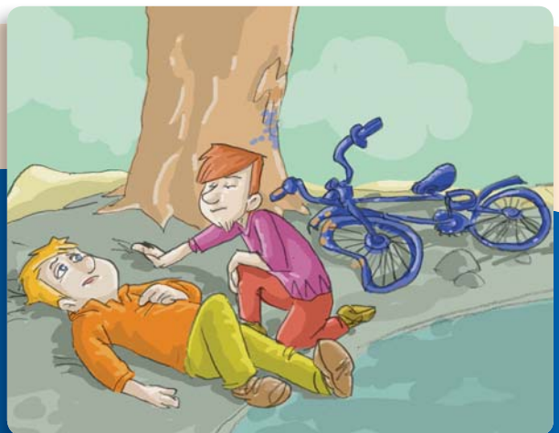
Figura 1: La capacidad de liderazgo, el aplomo y el autocontrol son fundamentales a la hora de intervenir.

reaccionar de modos no previstos. Entonces es cuando se ponen en juego diferentes cuestiones, en las que es importante no sólo el conocimiento, sino también ciertos detalles de personalidad, como la capacidad de liderazgo, de decisión, el aplomo y el autocontrol.