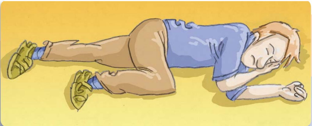
Figura 8: Si la persona no reacciona, colóquela en esta posición y aguarde la ayuda.

Si la persona está consciente y es capaz de comprender, es conveniente tranquilizarla y brindarle confort hasta que lleguen los profesionales. En cambio, si la persona no reacciona y respira, y usted se encuentra solo, colóquela en posición lateral, extiéndale un brazo por encima de la cabeza y flexiónela la rodilla para estabilizarla. Recién entonces busque y solicite ayuda.