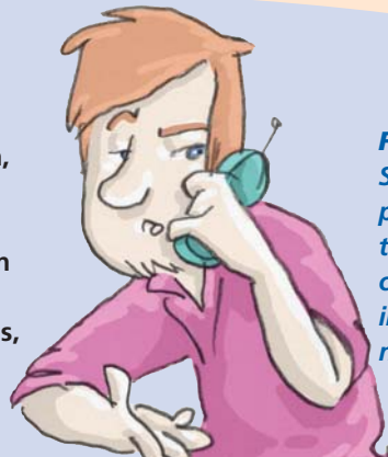
Figura 6: Si pide ayuda por teléfono, transmita con claridad la información necesaria.