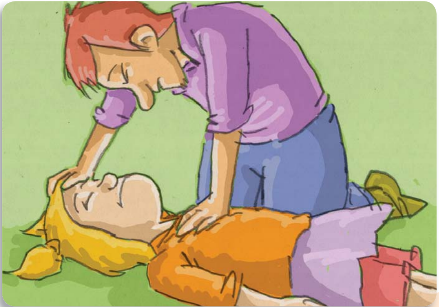
Figura 13: A diferencia de los adultos, las compresiones en niños se realizan con una sola mano.

En este caso, coloque la base de la palma de una sola mano (en lugar de las dos) en el centro del pecho, entre sus pezones, y realice 30 compresiones (Figura 13).