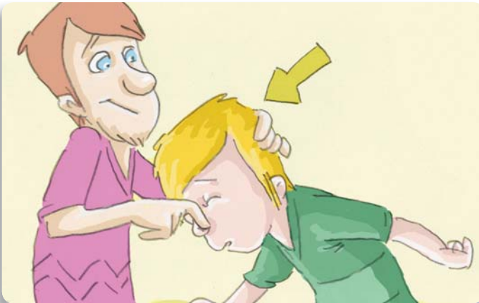
Figura 28: Para detener una hemorragia nasal presione a ambos lados de la nariz manteniendo la cabeza inclinada hacia adelante.