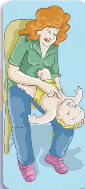
Figura 18: Gire al bebé y comprima cinco veces el tórax con dos dedos.